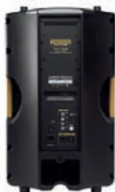
TH-15A – zadní panel