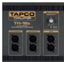
TH-18s – detail zadního panelu