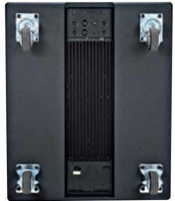
SWA1801z – zadní pohled