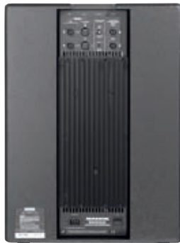
SWA1501 – zadní pohled