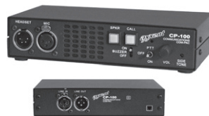
CP-100 Loudspeaker Station