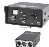
BP-100 Belt Pack