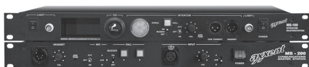
MS-100 Master Station MS-200 Master Station