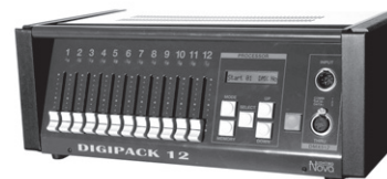
NOVA DGP12W2 digitální stmívač 12×6 A, 12 tahových pot., výstup 2×Wieland 16 pin., nastavení 12 nálad, přívod 5/32 A