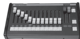
NOVA Minor 12 DMX pulstík 12 kanálů, vč. napaječe