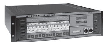
NOVA CDD122W digitální stmívač 12×10 A, 19"/3 U/hl. 450 mm, komfortní vybavení, výstup na konektory Wieland