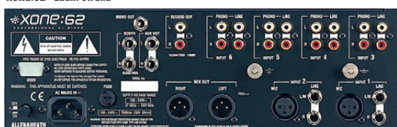
XONE:62 - zadní strana