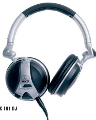
K 181 DJ