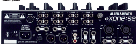
XONE:92 - zadní panel