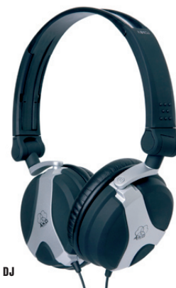
K 81 DJ